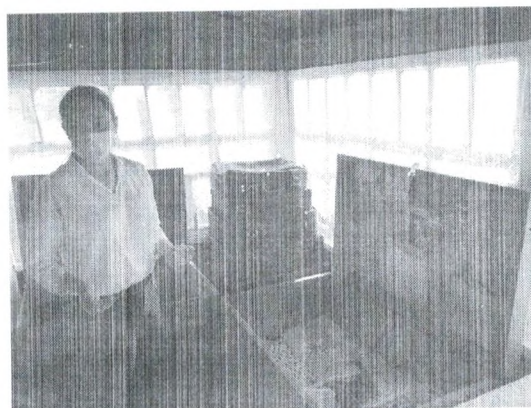
Рис. 2. Ученица МБОУ СОШ № 16 - экскурсовод музея