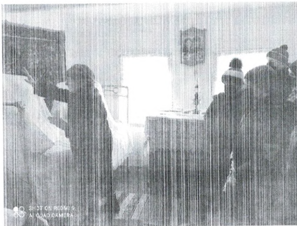
Рис. 5. Интерактивная экскурсия учащихся МБОУ СОШ № 16

Весь исследовательский материал будет удобен и полезен и для исследователей – они получают источники, факты, и для практиков – у них появится возможность на основе аутентичного материала готовить тематические уроки, писать сценарии и многое другое.