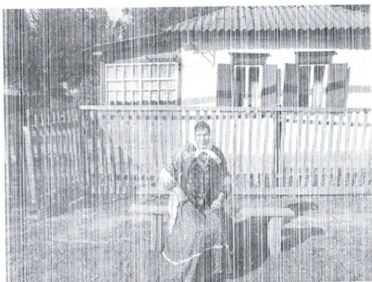
Рис.1. Интерактивный музей «В гостях у бабушки»

обязаны ее сохранить и поделиться, дать возможность ей воспитывать в душах детей любовь к малой родине, гордость за свой край. Потеря этого невосполнима, история нуждается в защите и восполнении.