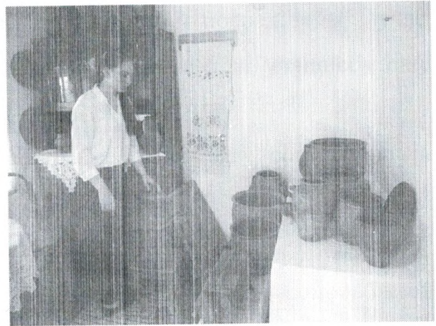
Рис. 4. Ученица МБОУ СОШ № 16 – экскурсовод музея

Весь исследовательский материал будет удобен и полезен и для исследователей – они получают источники, факты, и для практиков – у них появится возможность на основе аутентичного материала готовить тематические уроки, писать сценарии и многое другое.