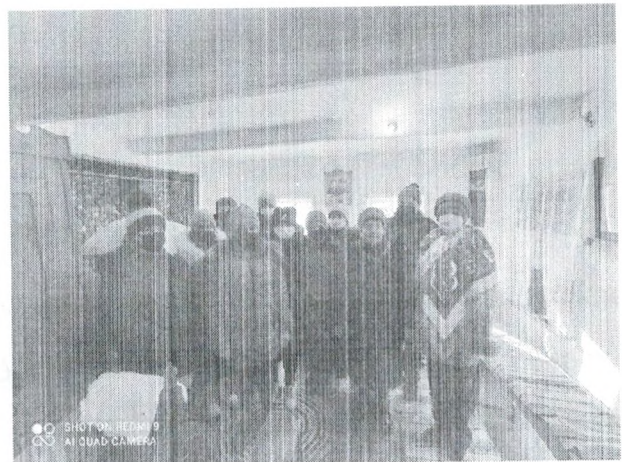
Рис. 6. Посещение интерактивного музея учащимися МБОУ СОШ № 16

-будет собран словарь местных диалектных слов и выражений, имеющий особую ценность как исторический источник, в связи с усилением миграции населения и постепенным растворением носителей диалекта в потоке прибывающих новых жителей;